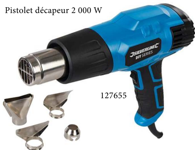
Pistolet décapeur 2 000 W